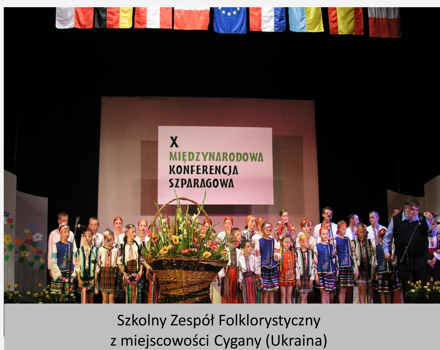
Szkolny Zespół Folklorystyczny z miejscowości Cygany (Ukraina)